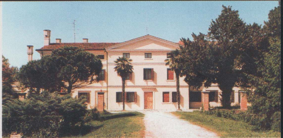
La villa - The town-house - Villa

I vini: Lison Pramaggiore: Chardonnay, Pinot bianco, Pinot grigio, Riesling italoico, Tocai italoico, Cabernet, Cabernet franc, Merlot, Refosco. Il Novello: Il Novo. I Frizzanti: Favit bianco, Favit rosato. Gli Spumanti: Prosecco spumante, Spumante Brian brut, Spumante Brian extra dry. Vini D.O.C.: Friuli Grave Cantina Le Telizze Colli orientali del Friuli Cantina Poggiobello.